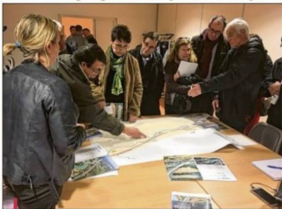
La possible création d'un nouvel aménagement autoroutier au Talagard inquiète les riverains. Ici des Salonais à la Maison de la vie associative lors de la concertation publique.

Si les signataires rejettent la construction d'un nouvel aménagement autoroutier au Talagard, ils ne s'opposent pas pour autant à sa création quelques kilomètres plus au nord, à Roquerousse. Dans le projet présenté en concertation publique, Vinci autoroute a en effet étudié cinq variantes (voir schémas) : deux entrées différentes au Talagard dites "Talagard en épingles" et "Talagard droit" ainsi qu'une sortie, mais également une entrée et une sortie à Roquerousse, la combinaison défendue par les riverains mécontents. Mais lorsqu'on parcourt le document édité par Vinci au-